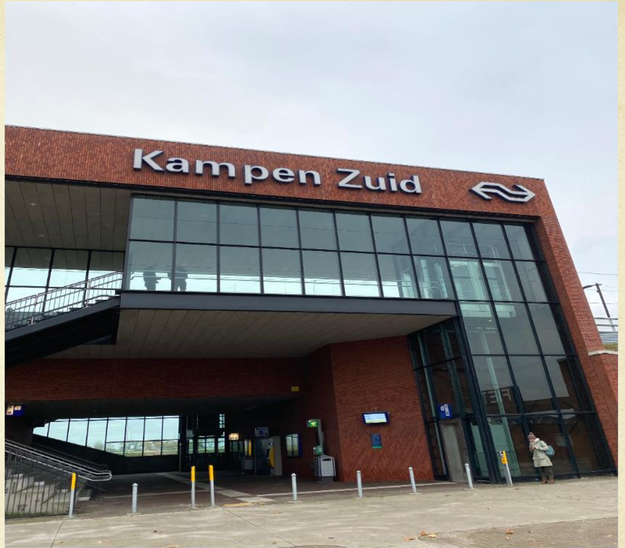
在荷蘭坎彭參加研討會