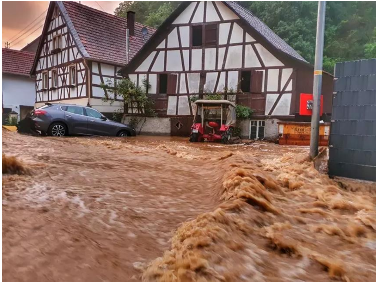
德國災情最慘重地區之一

西歐連日洪災至少已造成逾190人死亡，其中德國至少占了160人，仍有數十人下落不明。紐約時報報導，多名氣象學家和德國官員指出，這種規模的洪患是500年到1000年一遇。