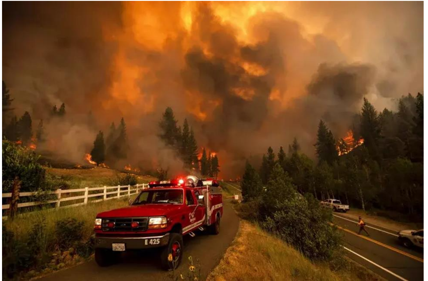
「塔馬拉克山火」的濃煙

BBC報導，專家指出，全球暖化讓災難性暴雨發生頻率提高。跟工業時代初期相較，地球均溫已提高大約攝氏1.2度。