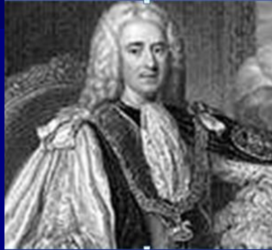
Gilbert West & George Lyttelton